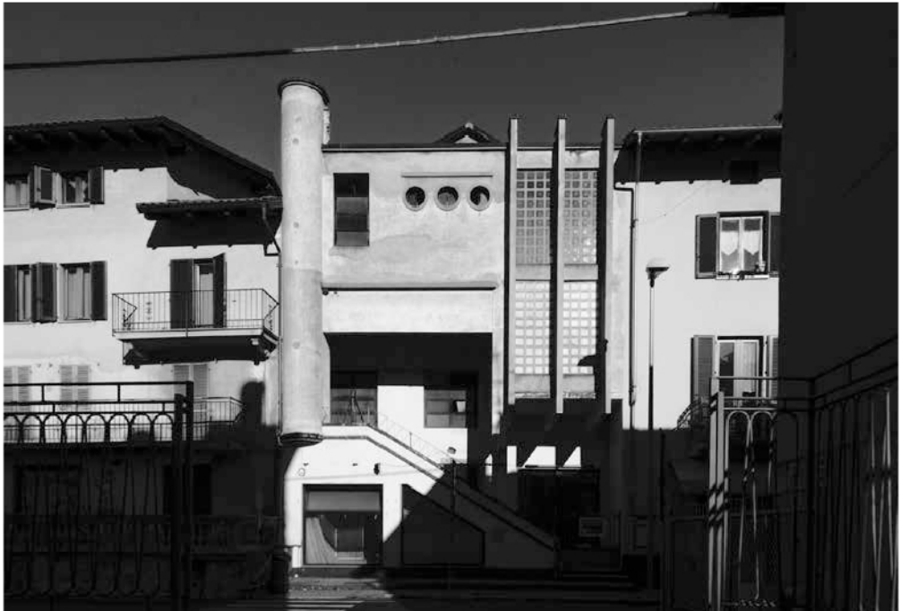
Ex cinema Excelsior de Pray biellese. Fotografías de Silvia Banfo, 2016.

Diálogo de la película Cinema Paradiso , dirigida por Giuseppe Tornatore (1988).